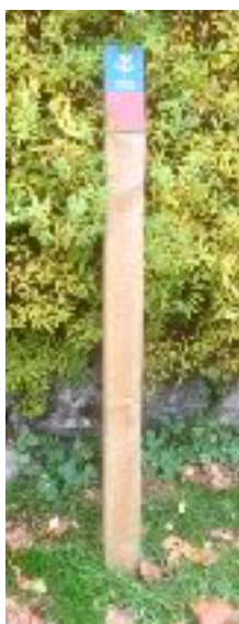
Informationstavlan visar en överblick över stråken. Följ vägvisningen och upptäck Lilla Sundborn och Stora Hyttnäs trädgård.