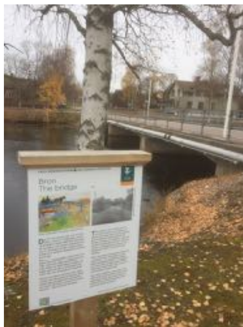
Carl Larssons tavlor visar flera platser där byn har förändrats drastiskt under senaste seklet.